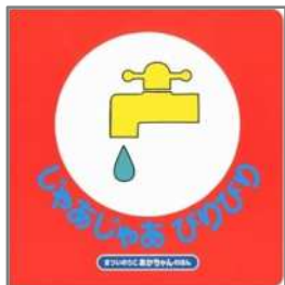
じゃあじゃあ びりびり まつい のりこ/作・絵 偕成社

赤ちゃんは、リズムカルな繰り返しの言葉が大好き。 言葉のひびきを音として全身で受け止めます。