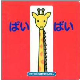
ばいばい まつい のりこ/作・絵 偕成社

赤ちゃんの生活の中での実際の体験と、絵本の世界の中での体験が重なることで、より大きな喜びになります。