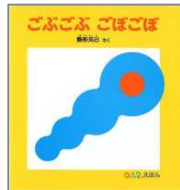
ごぶごぶ ごぼごぼ 駒形 克己/作 福音館書店