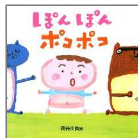
ぼんぼん ポコポコ 長谷川 義史/作・絵 金の星社