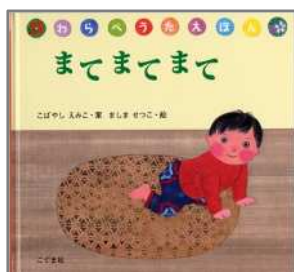
まてまてまて こばやし えみこ/案 ましま せつこ/絵 こぐま社