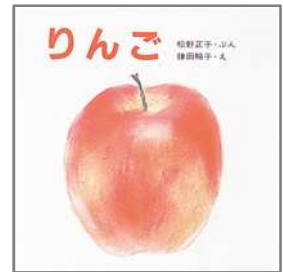
りんご 松野 正子/文 鎌田 暢子/絵 童心社