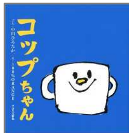
コップちゃん 中川 ひろたか/作 100%Orange/絵 ブロンズ新社

このリストにのっている絵本は、えほんのへやのほか、宗像市民図書館全館にそろえています。