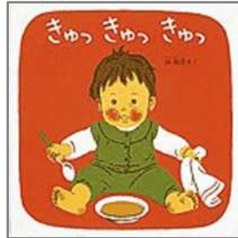
きゅっきゅっきゅつ 林 明子/作 福音館書店