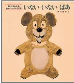
いないいないばあ 松谷 みよ子/作 瀬川 康男/絵 童心社