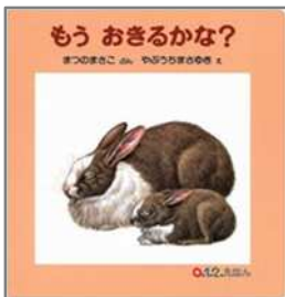
もう おきるかな? まつの まさこ/文 やぶうち まさゆき/絵 福音館書店