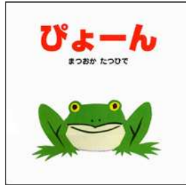
ぴょーん まつおか たつひで/作・絵 ポプラ社