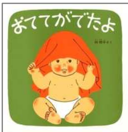
おててがでたよ 林 明子/作 福音館書店