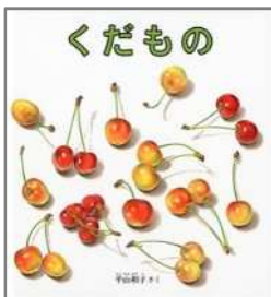
くだもの 平山 和子/作 福音館書店

知っているものが出てくると、赤ちゃんは喜びます。 本物そっくりの絵も大好きです。