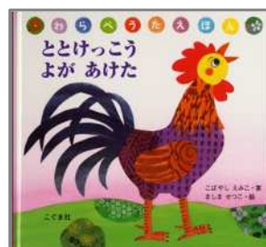
ととけっこう よが あけた こばやし えみこ/案 ましま せつこ/絵 こぐま社