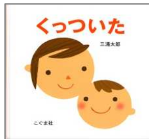
くつついた 三浦 太郎/作・絵 こぐま社