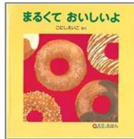
まるくて いいよ こにし えいこ/作 福音館書店