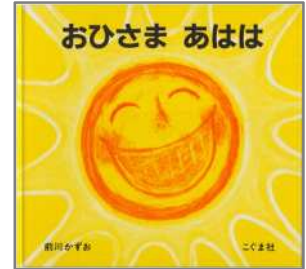
おひさま あはは 前川 かずお/作・絵 こぐま社