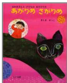
あがりめ さがりめ ましま せつこ/絵 こぐま社

うたをやさしく歌ってあげると、赤ちゃんは喜びます。 わらべうたは、少し 節（ふし）をつけて読むと楽しめます。