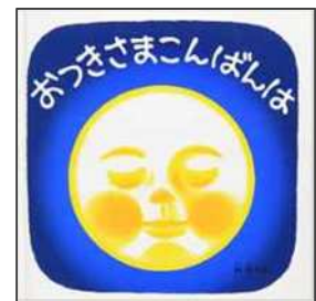
おつきさまこんばんは 林 明子/作 福音館書店