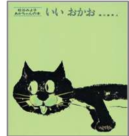
いい おかお 松谷 みよ子/作 瀬川 康男/絵 童心社