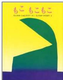
もこもこもこ たにかわ しゅんたろう/作 もとなが さだまさ/絵 文研出版