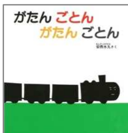
がたんごとなん がたんごとなん 安西 水丸/作 福音館書店