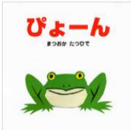
まつおか たつひで/作・絵 ポプラ社