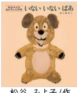
松谷 みよ子/作 瀬川 康男/絵 童心社