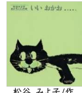
松谷 みよ子/作 瀬川 康男/絵 童心社