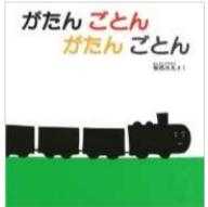
安西 水丸/作 福音館書店