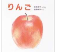
松野 正子/文 鎌田 暢子/絵 童心社