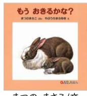
まつの まさこ/文 やぶうち まさゆき/絵 福音館書店