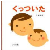
三浦 太郎/作・絵 こぐま社