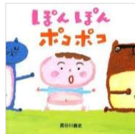
長谷川 義史/作・絵 金の星社