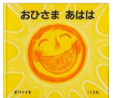
前川 かずお/作・絵 こぐま社