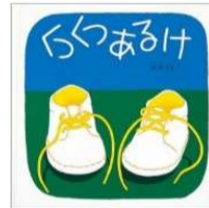
林 明子/作 福音館書店