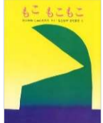
たにかわ しゅんたろう/作 もとなが さだまさ/絵 文研出版