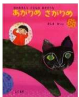
ましま せつこ/絵 こぐま社