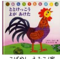
こばやし えみこ/案 ましま せつこ/絵 こぐま社