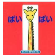
まつのりこ/作・絵 偕成社