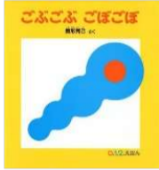
駒形 克己/作 福音館書店