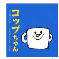
中川 ひろたか/作 100%Orange/絵 ブロンズ新社