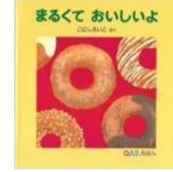
こにし えいこ/作 福音館書店