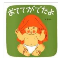
林 明子/作 福音館書店