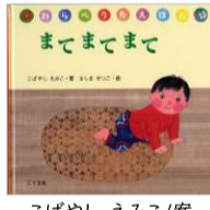
こばやし えみこ/案 ましま せつこ/絵 こぐま社