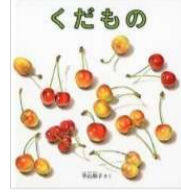
平山 和子/作 福音館書店