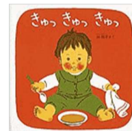
林 明子/作 福音館書店