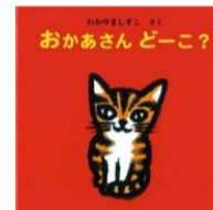
わかやま ますこ/作 童心社