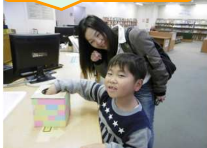
なにが当たったかな?