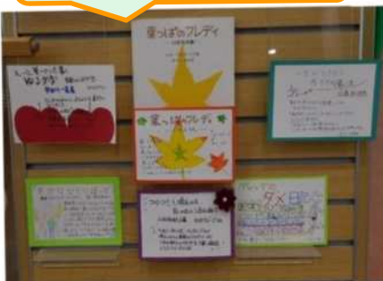
須恵分館で掲示中です。