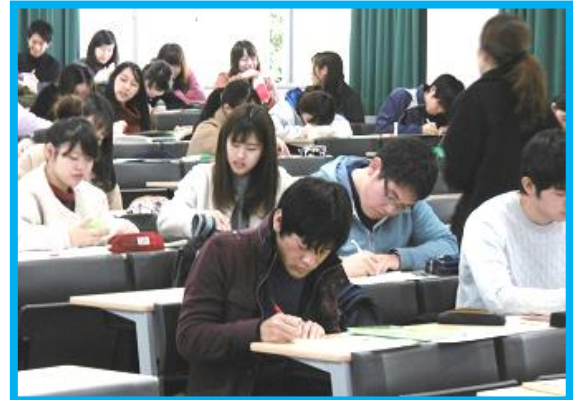
図書館の本を使って調べています