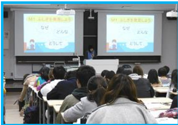
今日は、調べ学習にチャレンジです！