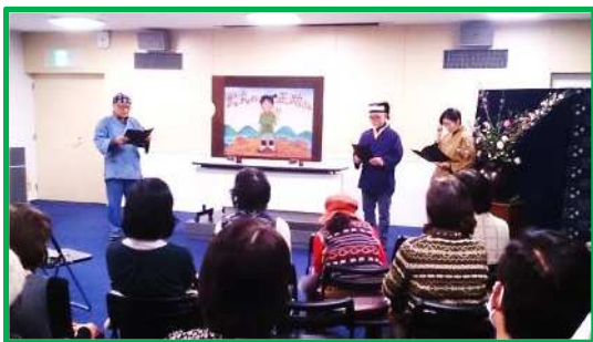
昨年度の発表会の様子