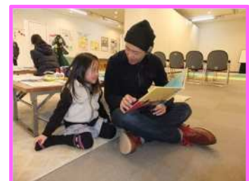
絵本を楽しむ親子

申込方法:1月18日(月)10:00から、ふらっこ(37-3741)に電話か来館して申込む