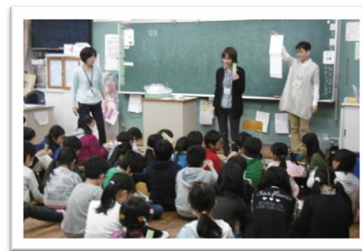
赤間小学校3年生の理科の授業