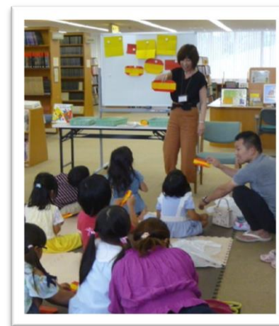
宗像ユリックス図書館 30周年記念イベント