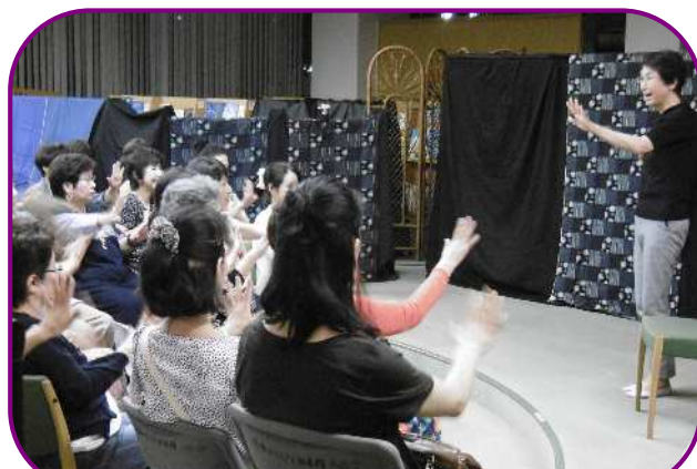
手遊び歌でリラックス