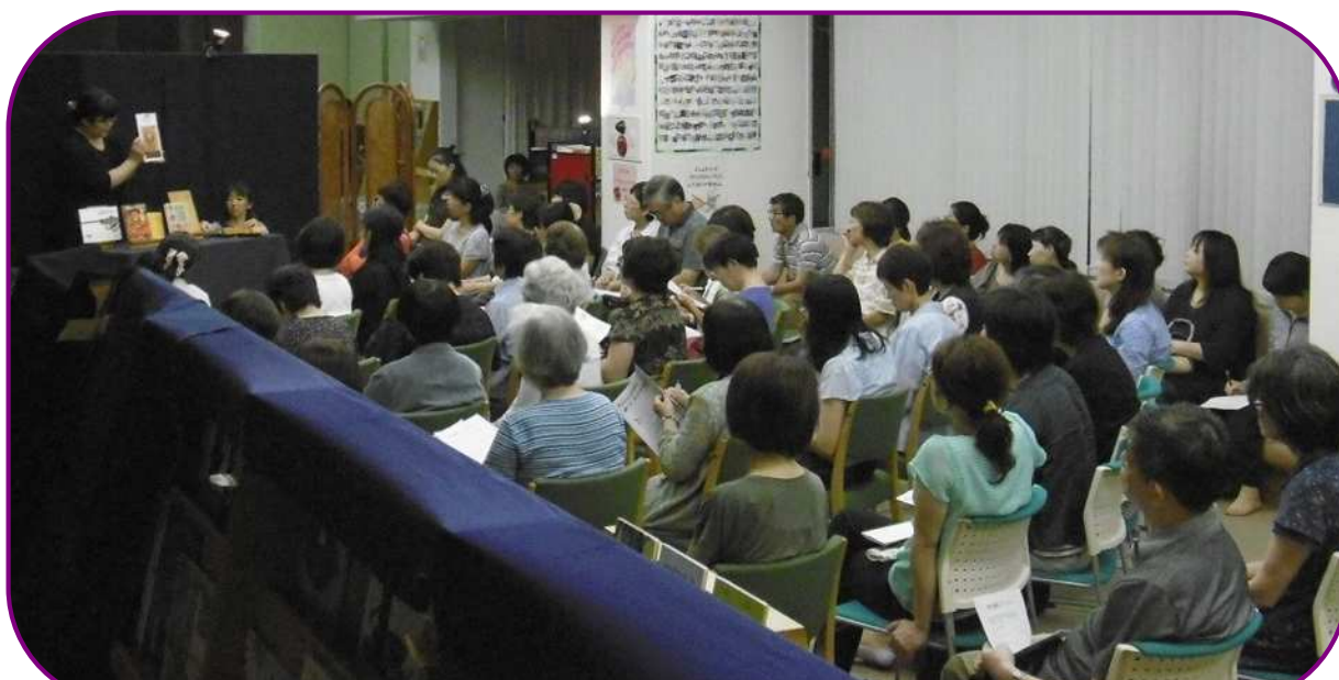
ストーリーテリングで語られたお話が載っている本を紹介