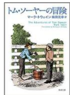
『トム・ソーヤーの冒険』新潮社 柴田元幸／訳