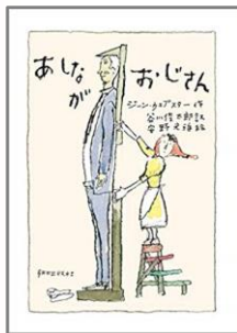
『あしながおじさん』朝日出版社 谷川俊太郎／訳 安野光雅／絵

ジーン・ウェブスターは、1876年にニューヨークで生まれました。大学生の時から社会事業に興味を持ち、1912年に『Daddy Long Legs』を出版。1915年には続編となる『Dear Enemy』を発表。主人公ジュディの手紙で構成される書簡体小説。